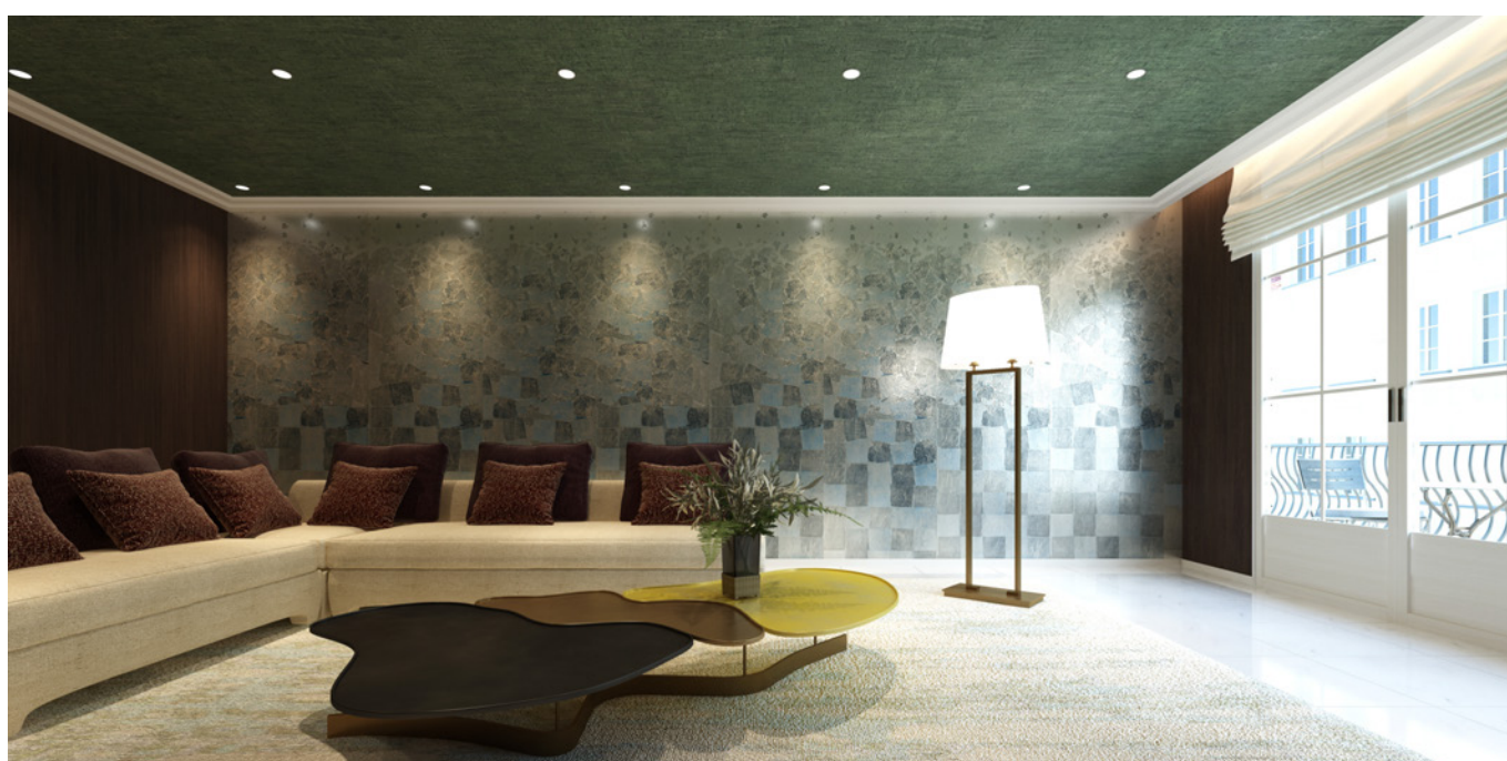
壁紙のパターンが切り替えられる「IDEA box」

『トミタバーチャルショールーム』は Web 上で、それぞれの素材で施工された空間を、いつでもどこでも気兼ねなく見て回れる仮想空間のショールームです。別荘スタイルの「Landscape」、日中と夜間の光を切り替え可能なアーバンスタイル「Tokyo Silent」、和モダンな「Kyoto hideout」、そして壁紙パターンの切り替えにより様変わりする空間が体感できる「IDEA box」の、4つの異なる空間をご用意しました。